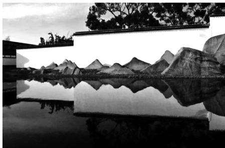
图3 苏州博物馆假山

度更加多元化,其中以参观游览的角度较为多见。以苏州博物馆为例,其在游览的路线上,以白墙为底,用纹理变化细腻丰富的片石,塑造了一片水墨山水(图3)。其不拘泥于古典园林假山叠置对“真”的要求,但也同样在新的视角下展现了“千里江山只在方寸”的神韵。