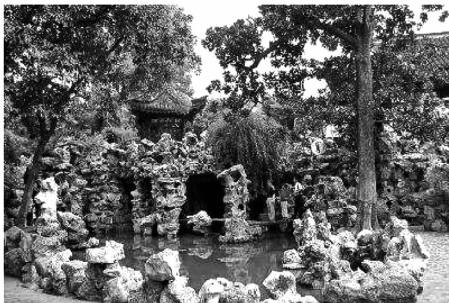
图4 苏州狮子林假山

但是新中式园林在叠山置石上有时会步入误区,效法日本枯山水的做法。实际上,古典园林假山与枯山水可观而不可游迥然异趣,除了供人观赏之外,古典园林假山亦可使人亲历石矶、峡谷、溪涧、山顶等山中种种境界(图4)。