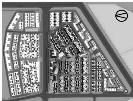
图2 万科·第五园总平面