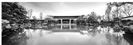
图5 苏州山水比德园林

中国古典园林以山水景观为主体,建筑物作为居止处、观景点,在其中仅仅起到配角的作用。既如此,建筑物的形制、尺度、色彩包括修建的位置都要对园林整体起到衬托作用,而不能喧宾夺主、自我表现。以江南园林建筑为例,其园林建筑风格完全独立于住宅建筑之外,形成了活泼、玲珑、空透、典雅的特点。这些特点是由其文脉和地脉相互影响而形成的。