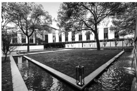
图7 九里云松度假酒店

Fig. 6 Shanghai Yu Garden