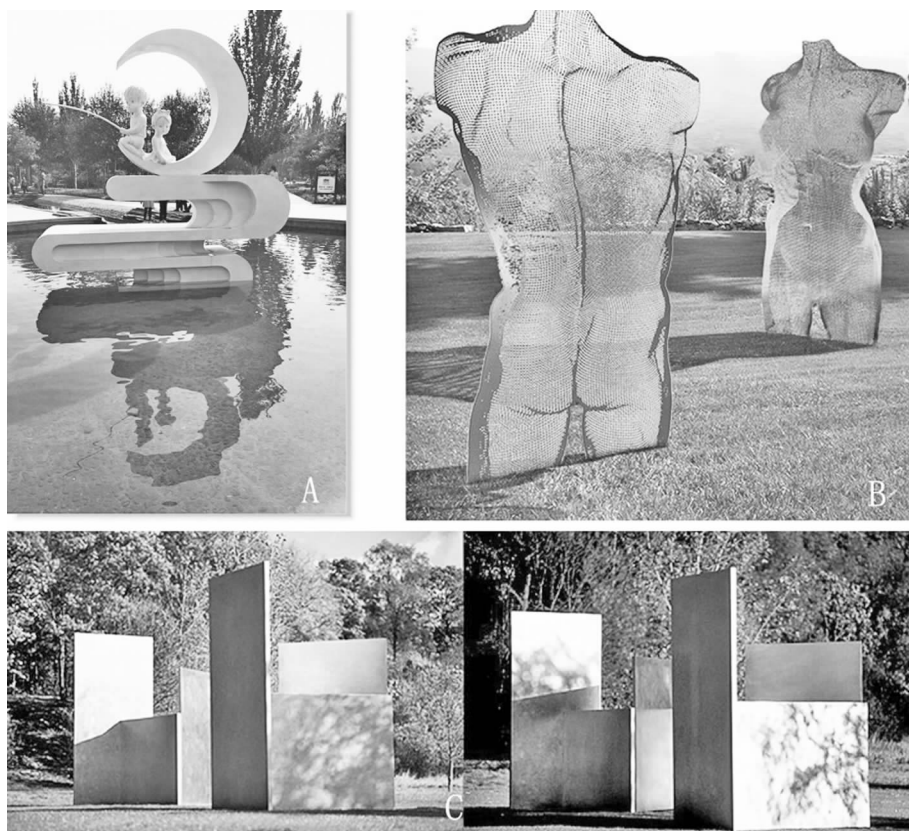
图 4 光影与小品的配合

雕塑的魅力表现得淋漓尽致。由图 4-A 看出,洁白的雕塑坐落于水体中,利用光线照射白色物质后的反射原理使雕塑表面产生朦胧柔和之感,再结合水面的粼粼倒影,使整个作品形体更加柔美饱满和富有纯净的诗意。图 4-B 使用了网状金属材料制作出不完整男女人体雕塑,若没有光影的融入,该作品将更加“残缺”。网状空隙由光线和外部环境填充,身体凹凸部分由阴影强化,可以说整个作品主要利用光影的塑造能力才得以“圆满”,也使观者在欣赏该残缺人体时,通过自我想象补充未制作出的身体部分,也由此感叹残缺的美丽与魅力。