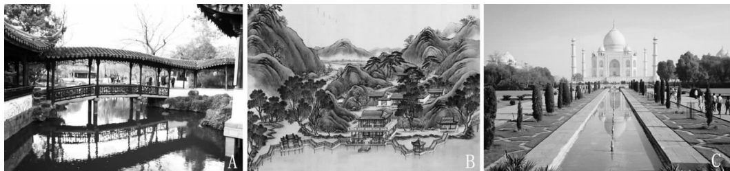
图 2 中西方园林光影与水景的配合

石构筑起泰姬·玛哈尔皇后典雅而庄重的陵墓,在灿烂的阳光下一颗珍珠闪耀。炽烈的光线将其投射入正前方狭长的水池中,水中的泰姬陵如泰姬本人般动人,让世人恍如看到天堂中的泰姬,也仿佛在诉说着这位佳人与皇帝沙贾汗凄美的爱情故事。