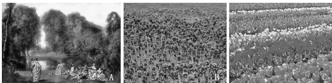
图 3 光影与植物搭配的景色

园林植物配置离不开色彩的搭配。不同颜色的植物会给人不同的观感,冷色会创造一个宁静清雅的景观(见图 3-B),暖色则会形成一个活泼温暖的环境(见图 3-C)。不同色调的植物在不同的光影效果下也会有不同的效果,如纯度较高的正红色在光照强度较低的情况下反而会更为鲜亮,纯度较低的粉红色次之,光线对于暗红色花系的影响是最大的,在光线较强的时候颜色会较为鲜艳,随着光线的减弱,颜色会变得暗淡。对于蓝色植物特别是蓝色花系,在光线较强的时候,其颜色使人感觉凉爽自在,但在光线不足的情况下,这