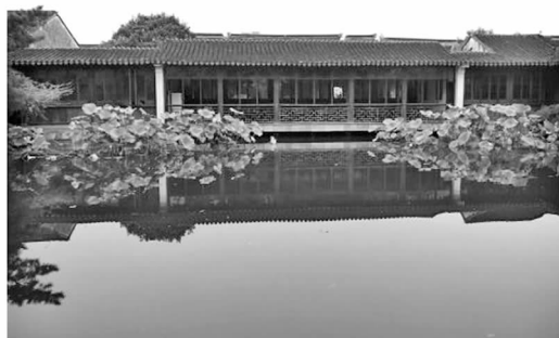
图 2 艺圃水榭

水面相接,使得视野变得相当的开阔,因而,作为住宅一部分的水榭也成了观赏全园景点的最佳观赏点。观赏到的景色开阔大气,别具一格(见图 2)。艺圃的主景区成开阔景象,除了较大水面外,鲜有建筑物,只有东侧的一座乳鱼亭成了点睛之笔。