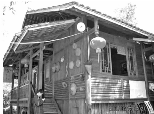
图7 生活器具的墙面装饰

了浓郁的乡间生活情趣,给人一种回归乡土、回归自然之感(见图7);广西民族博物馆主铜鼓建筑玻璃幕墙上的磨砂印花壮族元素图案,都是运用壮族文化元素装饰园林建筑的很好例证。