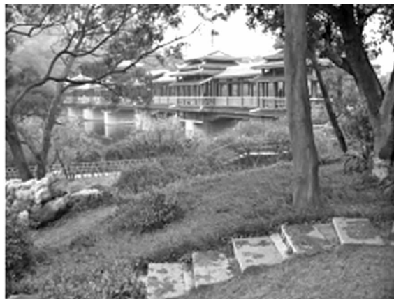
图1 龙潭公园风雨桥

地域文化,广义上指的是不同地域独具特色,传承至今仍发挥作用的传统文化 [4] 。作为园林中的点状要素,园林建筑从外表装饰、造型、材料、质感及功能上都应具有一定的地域文化内涵。如柳州龙潭公园静卧镜湖上的“龙潭风雨桥”系仿古钢筋混凝土廊桥式建筑,以三江程阳风雨桥为基本设计建造而成。整座桥亭飞檐重阁、琉璃瓦饰,极具三江侗族特色,延续了地方文化(见图1)。