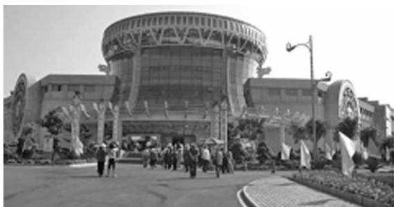
图3 铜鼓造型的广西博物馆

具有相对较大体量的园林建筑,可以成为城市片区的标志性建筑。如南宁国际会展中心、广西民族博物馆等一批集适用与观赏功能于一体的会展建筑逐步建成,成为了南宁的地标性建筑 [6] (见图3)。