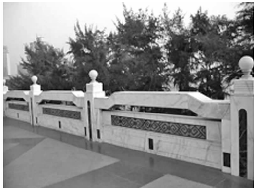
图6 壮锦图案的栏杆装饰

法见表2,以期通过细部的装饰体现园林建筑的精美与文化。如运用壮锦图案中的回字纹进行栏杆的装饰,古朴与素雅,极具民族韵味(见图6);广西南宁民族文物苑中的干栏建筑,在其墙面悬挂雨帽、簸箕、鱼篓等生活器物以作装饰,显示出