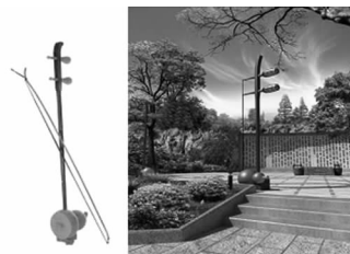
图8 乐器——葫芦琴在园灯造型中的运用