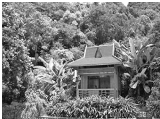
图4 周围环境融为一体的园林建筑

Fig. 4 Landscape architecture with to blend into the surroundings