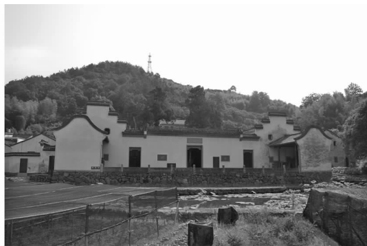
图 1 粉刷一新的墙面

由于斯宅民居建筑群潜藏于山脉之中,又地处诸暨、东阳和嵊县 3 市(县)接壤处,因此没有引起人们的重视,同时由于这里民风淳朴,斯氏后代对于祖居的珍惜,许多民居得以完好保存下来。但是由于年代已久,斯宅村的古建筑在不同程度上都受到自然及人为的破坏,部分外墙面开始风化、剥落,墙面长满青苔。随着经济的快速发展,现代的楼房取代了许多老建筑,一些建筑虽然受到了保护,但是却被换上了崭新的外墙,失去了历史的味道(见图 1,图 2)。许多民间传统手工艺由于不符合时代特点,已经被遗弃。斯宅村的一些古建筑上保留的特殊历史文字符号、留下的特殊的时代印记多数已经被覆盖。