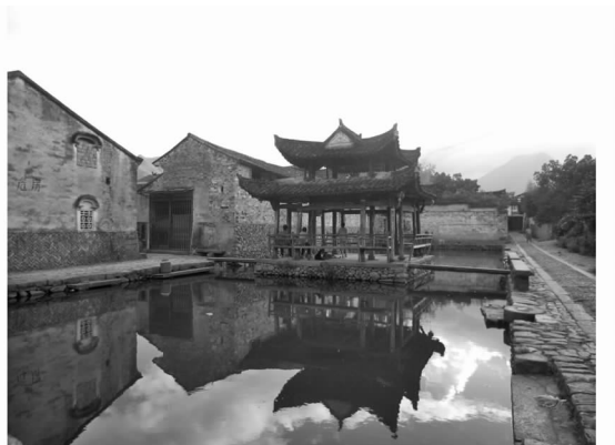
图 6 老建筑已经写上“危房”的警告 Fig. 6 Old building written warning of “Dangerous”

(见图 5,图 6)。芙蓉村已经开发了旅游,但却没有严格的管理措施,使得芙蓉村的环境受到了一定程度的破坏。