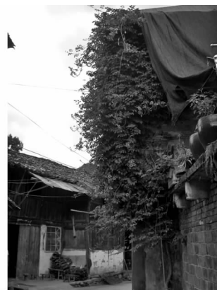
图5 老建筑已经破败不堪

芙蓉村毗邻海域,古民居多建于明朝初年,建筑风格与传统的江南建筑有很大区别,建筑墙体是轻盈通风的竹笆墙面。现在有些古建筑白粉层已经脱落,露出了竹笆结构,木结构由于年代久远,已经出现倾斜歪曲,外墙也出现了膨胀的情况,在一些建筑上甚至已经挂上了“危房”的警告牌