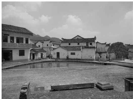
图3 时代发展新建的建筑

新叶村位于浙江杭州建德西南大慈岩镇,2000 年被批准为浙江省省级历史文化保护区。新叶村始建于宋末元初,从玉华叶氏第 1 代到这里安居后,历经宋、元、明、清、民国至今,共计 30 余代,一直没有间断地保持着血缘关系的聚落。新叶村排斥了各种外界的干扰,避开了战乱灾祸,在一块并不算富饶的土地上,繁衍成一个巨大的宗族 [8] 。村落的格局和古代建筑有规划,建筑质量好,村落发育程度相当高,建筑类型多,而且基本上完整地保留了下来 [9] (见图 3)。新叶村从元末明初开始衰落,整个的历史过程中都在不同时期构建的房舍中和聚落的规划中清晰地呈现出来。