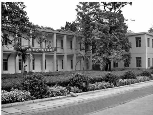
图6 第四教学楼内庭