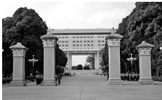
图2 广西大学旧大门

广西大学座北朝南,学校大门和城市主要干道相连,除提供出入,还是学校的标志之一。其绿地景观设计具有较强的装饰和美化效果,既体现学校的特色,又与街景相协调。大门有内外两重,一为现在的正门,一为建校初期建造的旧门(见图2)。正门为景观石与罗马柱共同构成,景观石上刻有四个金色大字——广西大学,在阳光下闪闪发光,沿着道路两旁的绿荫前行 100 m 左右,就到了旧门。气宇不凡的四座具有欧式风格的柱子,颇具历史,呈长方体,宽约 1 m,高约 5~6 m,