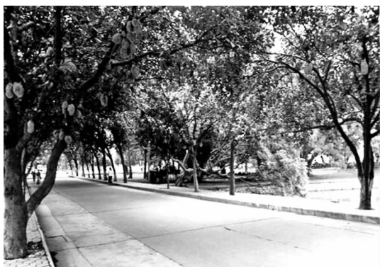
图 10 木菠萝行道树

神怡。(2)观花路。行道树以开花乔木为主的道路,开花时节形成美丽悦目的道路景观,如雁山路、农场路的羊蹄甲。(3)绿色廊道。行道树种植冠大荫浓的树种,道路两旁大树的枝叶在天空相互交错,形成绿色廊道。如种有榕树,小叶榕、橡胶榕的路,以通和路为最好。(4)观果路。以果树作为行道树,丰收时节,硕果累累、赏心悦目,成为广西大学一大道路景观特色。如君武路的木菠萝(见图 10)、碧云路和东苑路的芒果等。