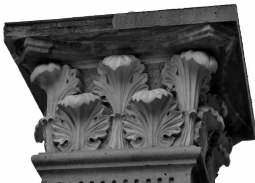
图3 旧大门上的精美雕饰