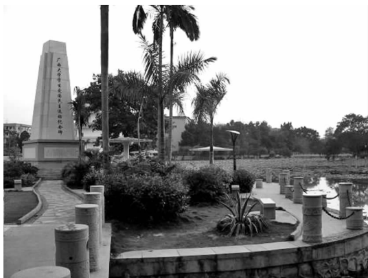
图7 碧云湖·彩叶广场

观,沿湖畔水边设置有亲水平台,纪念碑、亭,观赏置石,亲水花廊,装饰灯柱以及地灯诸景,突出水、景、人之间的结合。水面与岸边绿荫坡地连成一体,局部设置曲岸,形成蜿蜒曲直的水岸景观。在植物配置方面,选用大王椰、假槟榔、金边龙舌兰、咖啡、家麻、散尾葵、美人蕉和鸡蛋花等热带树种,通过植物群植的体块、色彩、肌理的对比,创造了独特鲜明的绿地景观形象(见图7)。而碧云湖湖心岛的学生运动纪念碑处,除了让学生们缅怀烈士,激发学生的爱国热情外,其设置的亲水平台、蘑菇亭给学生们提供了一个幽静休闲的交流环境(见图8)。