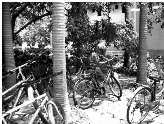
图9 停满单车的绿地

山、景石、亭、廊和花架等园林小品供观赏风景,休闲散步、静心读书、朝夕锻炼。小游园面积并不大,学生在校园中使用方便,但杂草较多,空间较为闭合,利用率不高,只是基本满足绿化的要求。很多绿地只能看而不便进入,有些虽然设有休息交流的空间,但位置不合理,很少有人使用,或被作为其它用途,如停放单车(见图9)、晾晒衣被。