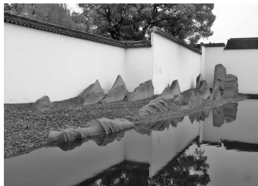
图 3 苏州博物馆新馆片石假山

苏州古典园林的假山,往往注重山的体量感和立体感,注重所谓漏、透、瘦,这些假山大多具有可穿透性和可攀爬性 [5] 。贝聿铭在苏州博物馆新馆主庭院中设计的片石假山,以壁为纸,以石为绘,粉墙之上俨然呈现了一幅立体的水墨写意山水画卷(见图 3),给观者带来了强烈的视觉冲击。