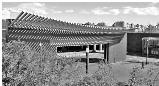
图 2 午门意象

同样,1 号院“御道宫门”也采用了钢结构梁柱体系表达紫禁城午门的意象(见图 2),宫门顶端南侧为挑檐深远的棚架,8 m 和 4 m 长两种型材交错布置,形成了两条曲线,抽象的表达了反宇向阳的中国建筑神韵。