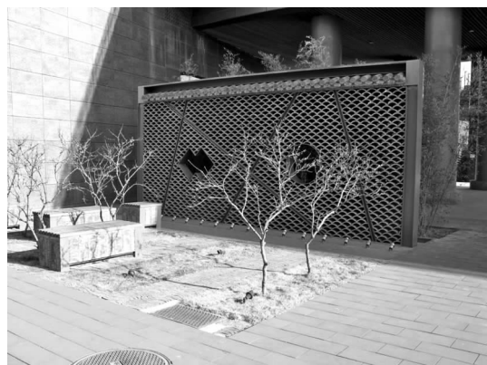
图 7 瓦墙 Fig. 7 Tile Wall

在景观设计中,材料是最基本的元素,通过合理的运用材料,能形成景观的细部,最终产生景观空间上的创新 [8] 。中国传统园林经常使用的硬质景观材料大致有砖、瓦、石、木和土等。当代,新的景观材料层出不穷,如不锈钢等金属材料、玻璃、塑料、混凝土和陶瓷透水砖等为景观设计提供了广阔的设计空间。地方材料的使用已从过去的客观必要上升为今天的人文需求,传统与现代景观材料的合理搭配更是成为保护和发扬地方特色的重要表现手法。