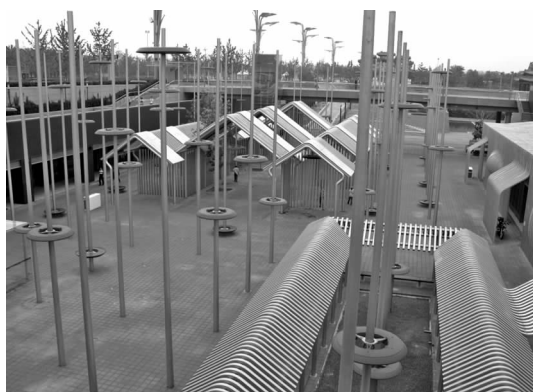
图 1 合院谐趣——似合院

北京奥林匹克公园下沉花园 6 号院“合院谐趣——似合院”,以老北京城四合院群落的屋顶为典型符号,利用统一规格的钢管表达四合院的梁柱结构体系,虽然造型被刻意大幅简化,但仍能使参观者体会到传统四合院建筑的韵味(见图 1)。