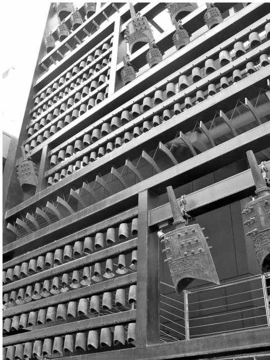
图 6 钟磬塔细部 Fig. 6 Detail of Belfry

特征,进行夸大或缩小,以加强艺术表现力和景观效果。在北京奥林匹克公园下沉花园 3 号院“礼乐重门”中,设计者选取了 243 面大鼓组成了一面高达 10 m 左右的鼓墙(见图 4),院中甬道自北向南排列着一人多高的金光闪亮的 16 根铜制“排箫”,高度依次递减(见图 5),钟磬塔上则挂满了编钟、铜磬和风铃(见图 6),将传统符号鼓、箫、编钟、磬和风铃等以夸张的尺度,进行重新组合,有秩序的排列,带给人强烈的视觉冲击,从而留下深刻的印象。