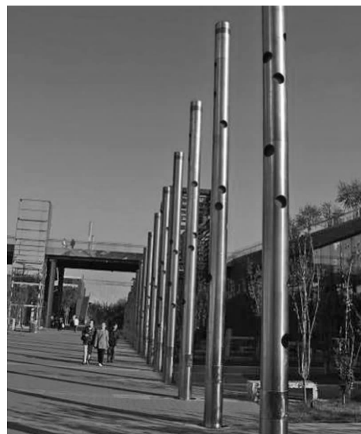
图 5 排箫