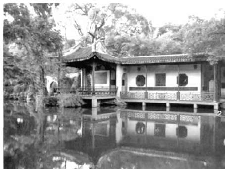
图 4 寄畅园之锦汇漪 Fig. 4 Jinhuiyi of Jichang Garden

二泉水入园,西面一支引自二泉书院中的香积池,香积池上通金莲、承泽池,再上通二泉,经过八音涧后流入锦汇漪;南面一支引自惠山寺的日月池,其上通金莲池,进入镜池后也注入锦汇漪(见图 4)。二泉水进入园以后,运用各种手法,组成各种有聚有散、有静有动、有大有小、有声有色的水景观。