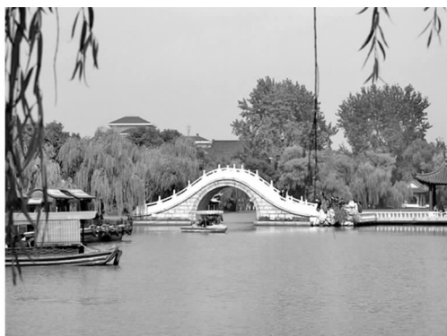
图7 扬州瘦西湖之单孔拱桥

用其它景观要素,或临水建筑、或廊桥、或植物、或山石都可以将水景的构图画面加以丰富,达到水中有园,园中有景,景中有水,步移景异的艺术观赏效果。