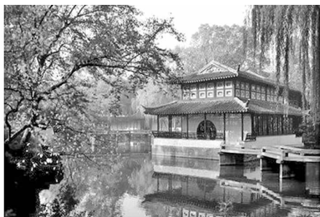
图 2 苏州拙政园之远香堂 Fig. 2 Drifting Fragrance Hall of Suzhou Humble Administrator's Garden

州西湖就依据地形条件,从大处布局着手,构筑两条大堤横贯湖的南北(苏堤)和东西(白堤),把全湖分割成外湖、里湖、岳湖、西亘湖和小南湖 5 个大小不同的水面,同时带动不同湖面水体、建筑和景桥等组合的优美景致。苏州的拙政园在水体所到之处点缀水榭、舫、桥、楼、阁、亭等,其或架于水上、或立于水边、或倒映水中、或掩映在花草山石之间,呈现出步移景异的视觉空间(见图 2)。中国园林的景致之处不仅在于师法自然,更要高于自然,达到情景交融、寓意深厚的情感境界。