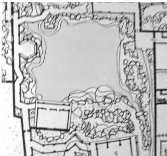
图 5 网师园之水体平面图

完全闭合的,在某些位置留了出水口,看上去仿佛是向外延伸的支流,实际上只是隐蔽的短短水弯。它以十分简洁的方式,突破了水面的封闭感,形成水体源流不尽的错觉,扩大了水体的空间观感。如网师园就在东南侧留有一水口,打破了整体水面的单一性,让观赏者疑似要引出另一段水景,使人产生无尽的想象(见图 5)。