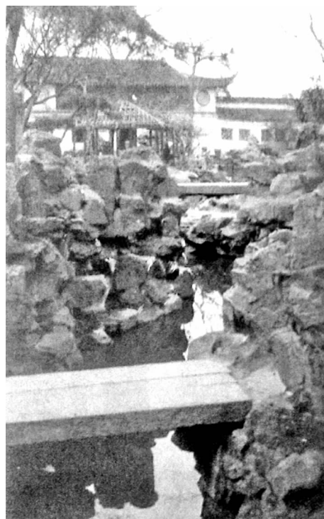
图1 自山洞东望之景(留园)

Fig. 1 Scene looked from the east of the mountain stream (Lingering Garden)