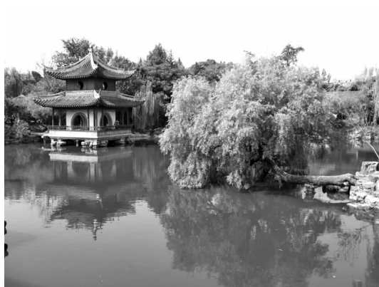
图5 与镜阁相盼的伸向湖面的垂柳

植物的四季变化便有了景观的四时之景,合理地运用植物在不同季节里的观赏特性来进行植物配置,使得园林具有了时间和空间上产生的对话,是一处园林能够经久不衰的基础。如洗钵池,原为唐代建造的中禅寺的放生池,位于中禅寺的左侧,因读书人常在池中洗钵而得名,水绘园的历代主人将洗钵池完整地保留下来,正是对苦苦勤