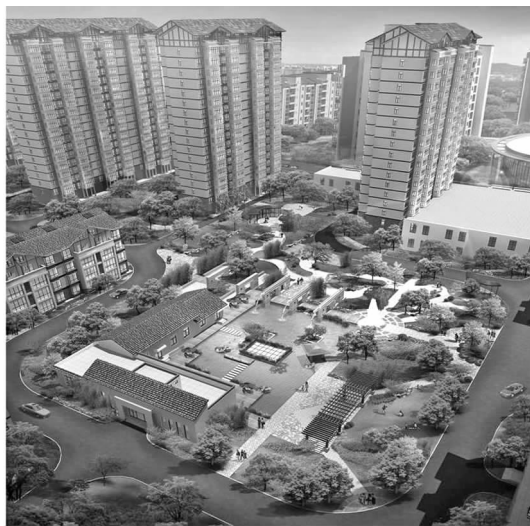
图3 中心景观区鸟瞰图