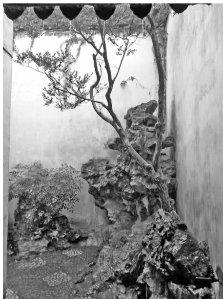
图4 狮子林某小院空间植物景观

同样的园林景观,对于具有深厚古典文化修养的人来说,其抒情性、其文化语言、其独特的民族审美底蕴,将得到最大限度的感知和认同。而对于缺乏这种先验性的审美认同的人来讲,也许