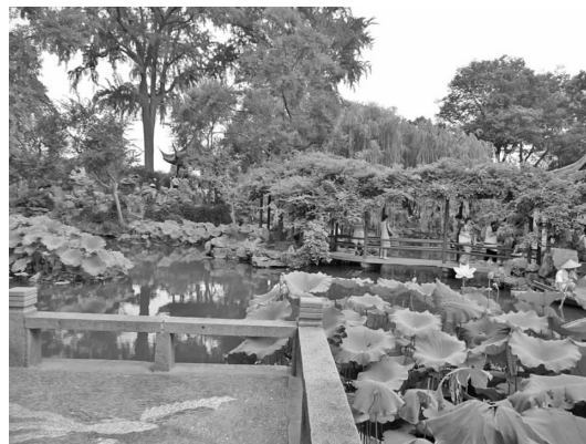
图1 留园中心庭院植物分隔园林空间

对于园林的有限空间,越加以分隔才会越多地产生空间无限的感觉。江南园林如此,即使是面积相对较大的皇家园林,也只有充分利用空间分隔,才能使深邃幽奥空间和园中园空间,不能一览无余,从而扩大了空间感受。如留园中心庭院东北部由水生植物、攀援植物,及岸边植物分隔园林空间,丰富园林景观层次(见图1),可以看出植