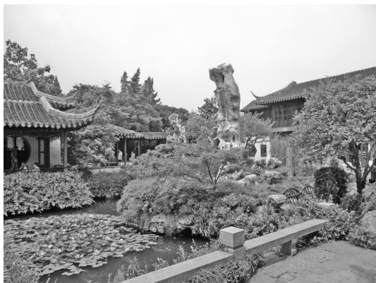
图2 留园冠云峰及其周围微型植物配置和小型水池