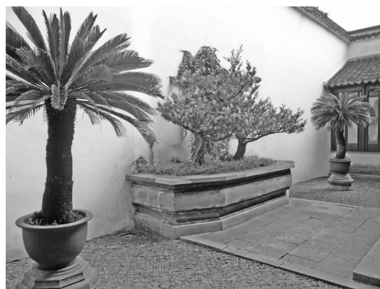
图 6 留园某庭院盆景

另外,古典园林庭院盆栽的应用,使狭小空间生机盎然(见图 6)。盆栽之妙在于小中见大,栽来小树连盆活,缩得群峰入座青,我国盆栽的产生与建筑具有密切的关系,古代住宅,以院落天井组合而成,周以楼廊或墙垣,空间狭小,阳光较少,故吴下人家每以寸石尺树,布置小景,点缀其间……[4]