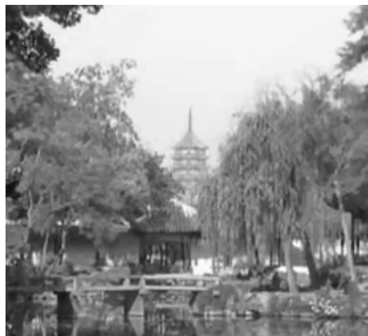
图3 拙政园借景北寺塔

园林是一个有限的空间,而园境则是一个无限空间,造成这种无限的重要手段是借景。造园借景,就是合理借鉴可用之景,把有限的园境扩大到无限的空间。植物在借景手法中的作用主要有三种:首先,植物作为凭借,借其它景:如拙政园借景北寺塔就是透过西面的树冠丛中,留出一条视线通透的借景空间,使游览者感觉远处的塔如在园中(见图3);其次,植物作为景,借入园内。同时植物四时变化,丰富园林空间;最后,借植物四时之景:园林设计,在同一空间里,随着季节时令的变化,配置观赏各异的花卉树木,使同一空间出现不同景色的季相变化,得到不同色彩,不同意境的空间。春天强调繁花似锦,夏日浓涂荷塘柳荫,秋季重抹层林尽染,冬月高显白雪松梅 [1] 。园林的时令、季相是由花木显示的,按时令配置花木显示不同景色,这是园林设计的重要手法之一。通过借植物四时不同景色,园林空间也产生丰富的变化。