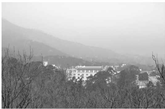
图3 对香山公园环境破坏较大的新建的香山饭店

目前,皇家园林中部分景点被单位占用的现象十分普遍,甚至有些部门在皇家园林中新建大量建筑等,严重破坏了皇家园林的整体氛围。如香山静宜园中香雾窟、玉华寺、栖月山庄等景点,在复建后作为办公或商业用途。新建的香山饭店、香山电话支局和香山别墅,建筑体量较大,且建筑风格与皇家园林氛围不符,新建的三座索道站,对周边环境都产生了严重的影响 [2] (见图3)。