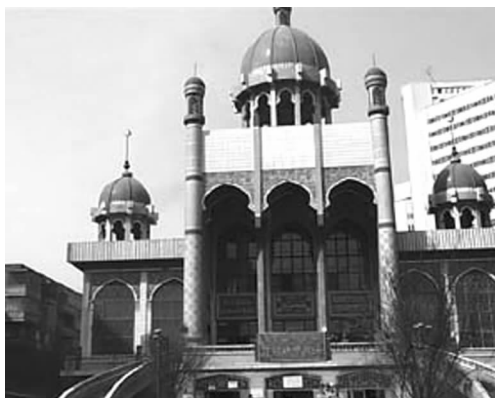
图2 汗腾格里清真寺