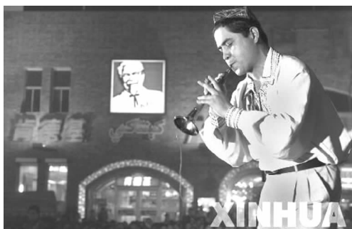
图3 大巴扎中的肯德基店

3.2.2 在意识形态上,使军垦文化景观成为城市精神文化的载体 以红山、和平渠为依托,借助于雕塑、宣传栏等建筑小品塑造以发扬军垦精神为主的文化景观,让人们在游览、休闲中通过欣赏得到愉悦,同时享受到文化的熏陶与教化。