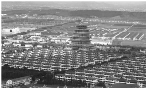
图 3 江苏华西村

和谐与发展是当今时代的主题,景观研究也不例外。但是不同的国家对乡村景观研究的侧重也有所不同。如欧美一些发达国家为了满足旅游的需求,比较注重生态保护及美学观光价值的研究,发展观光农业模式。日韩等国家则更注重传统乡村景观的开发和保护,通过举行“新村运动”和“美丽的日本乡村景观竞赛”等活动,宣传特色,树立典型,以求达到治理整顿乡村的目的。而我国与他们相比人口基数大,土地利用强度高,人地矛盾比较突出。据统计,我国的耕地面积由西汉时期的 3 713.3 万 \text{hm}^2 增长到 1989 年的 9 565.0 万 \text{hm}^2 ,但人均耕地面积却由 0.6 \text{hm}^2 下降到了 0.1 \text{hm}^2 [6] 。“三农”问题、乡村生态环境问题等严重制约着乡村景观的发展,因此转型中的乡村景观迫切需要正确的引导。