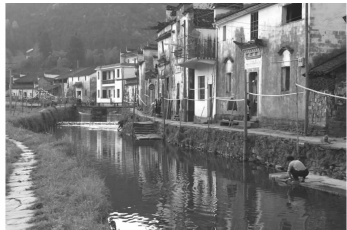
图 2 江西婺源

前所未有的速度进行着。截止 2007 年底,全国共有建制镇 19 249 个,比 2006 年减少 120 个,乡 15 120 个,比 2006 年减少 1 275 个。根据对 16 711 个建制镇、14 168 个乡、672 个农场、2 647 000 个自然村(其中村民委员会所在地 571 600 个)的统计,村镇户籍总人口 9.3 亿人,约占全国总人口 65%(2007 年城市、县城和村镇建设统计公报)。由数据显示,城市的扩张使乡镇数量减少,城市面积和人口不断增加,乡村城市化的脚步在进一步加快。乡村城市化使乡村景观园林正在经历着一场历史性的变革:一方面,一些有研究价值的传统乡村景观已经或将要遭到扼杀的命运;另一方面,乡村城市化已经或将要产生出新型的乡村景观。因此,我们在注重保护传统乡村景观的同时,也要致力于研究如何建设传统与现代因素和谐并存的新型乡村景观。