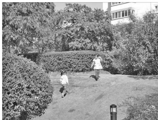
图9 在坡地上来回奔跑的孩子

有机的景观屏障,使得儿童活动场地受到外界干扰的几率减小,安全性大大提高,景观层次也更为丰富。孩子们结伴穿梭在树丛之中,在坡地上追逐打闹(见图9),与花草树木为伴,与虫蚁鸟兽为友,在玩耍的同时,也学会了交流与同情。