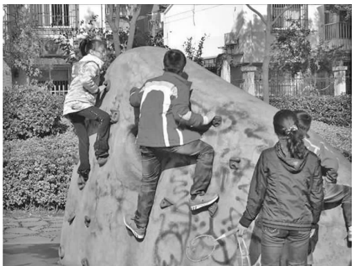
图2 攀岩的孩子 Fig.2 Climbing children

2.2.1 游戏器械区 公园内游戏器械区有三处,包括两个传统游戏器械区和一个极限广场。传统游戏器械区内布置了攀岩墙(见图2)以及滑梯(见图3),铺装为塑胶垫,增强了场地的安全性。滑滑梯吸引了很多低龄儿童,孩子们在玩耍时从众心理强,为了同一样器械而排队等候,不厌其烦,他们对滑滑梯、荡秋千这类传统游戏活动情有独钟;攀岩墙这类活动能够锻炼孩子的四肢协调能力,也能使孩子在这类冒险性活动中变得更勇敢,孩子们在完成有挑战性的活动后,会获得成就感,从而使他们有继续冒险的兴趣和勇气。然而,空间内器械仍过于单调,选择余地很小。