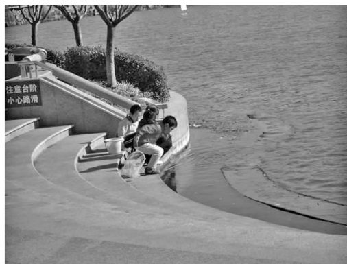
图8 亲水阶梯上戏水的孩子

公园内植物种类多样,季相特色明显,层次较为丰富。植物各式各样的色、形、味,激发了儿童对大自然的好奇,也激起了他们学习的兴趣。起伏的地形是南湖公园儿童活动场地的另一个特色,利用地形与植物配置的有机结合,营造了一道