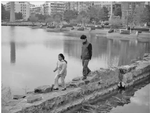
图6 人工栈道上行走的孩子

的水上廊桥,由石块堆砌的石质栈道(见图6),不仅是很好的观景点,也是孩子们嬉戏、冒险的场所。当然,水体也存在较大的安全隐患,设计时应注意控制水深并增加安全设施。