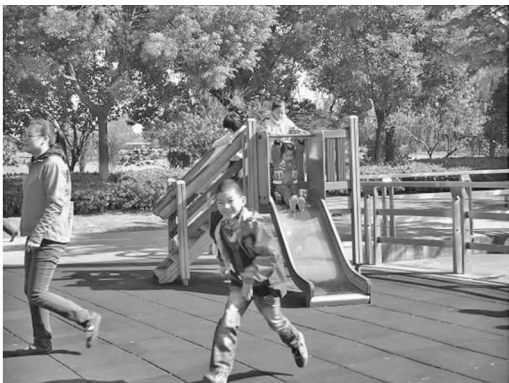
图3 玩滑梯的孩子 Fig.3 Children playing on the slide

极限广场内,设置了障碍地形,进行轮滑等要经过专业训练的挑战性运动,广场内不定期举行