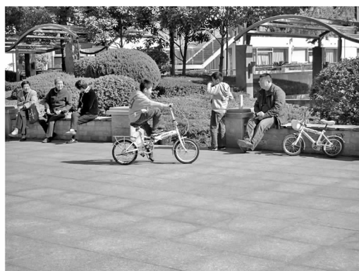
图4 铺装场地上骑车的孩子 Fig.4 Children riding on the pavement space

2.2.2 硬质铺装广场区 在硬质铺装广场,需不同尺度的空间。儿童的活动以动态活动为主,如骑自行车(见图4)、溜冰、追逐嬉戏等。这种类型的场地要求铺装平整,且要给家长提供坐息等待的较大尺度的铺装空间。其次广场铺装的色彩、形状、材质以及广场上的雕塑小品都能成为吸引儿童的因素。市民广场局部为彩色马赛克铺装(见图5),坐凳呈彩色且形状不规则,广场中布置了多个动物形态的雕塑。这些环境要素使整个广场变得更加有活力,也吸引了儿童的注意,他们喜欢在广场上追逐打闹,在仿生雕塑上爬上爬下。然而,坐凳和雕塑的尖锐棱角、光滑而坚硬的铺装表面,都对儿童构成了潜在的威胁。