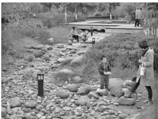
图7 在旱溪园中戏耍的孩子

比起水体,旱溪显得更为经济、安全,却也趣味无穷(见图7)。孩子们或结伴坐在较大的石块上聊天,或在石头上爬上爬下、追逐嬉戏,或埋头专心研究这些奇形怪状的石头。