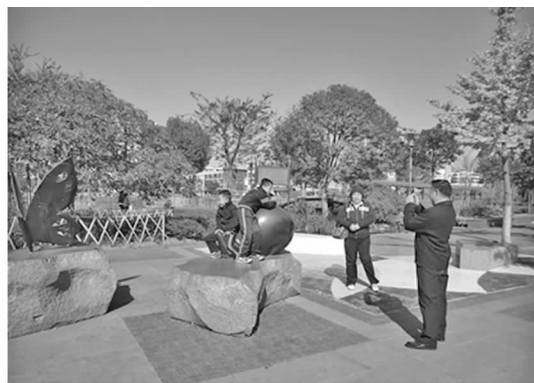
图5 彩色抽象铺装上认识色彩的孩子 Fig.5 Children on the abstract color pavement

2.2.3 亲水空间的营造 儿童有亲水的天性,水的活泼、灵动能激发孩子的想象力和创造力。南湖公园水域面积很大,营造了不同形式的亲水空间,如亲水平台使儿童能够与水亲密接触。水上栈道可以算是南湖公园的一个特色,总长达400 m,贯穿了公园内几乎所有水面。由木板铺就