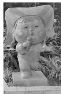
图 4 吉祥物“歌娃娃”

此外,2008 年广西壮族自治区 50 华诞的吉祥物——“桂娃”也极富壮民族色彩。“桂”是广西