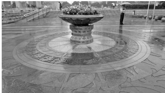
图 9 南宁市五象广场的地面铺装