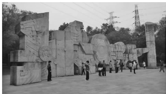
图 2 南宁市青秀山风景区壮锦广场 Fig.2 Zhuang Brocade Square in Qingxiu Scenic Area of Nanning city