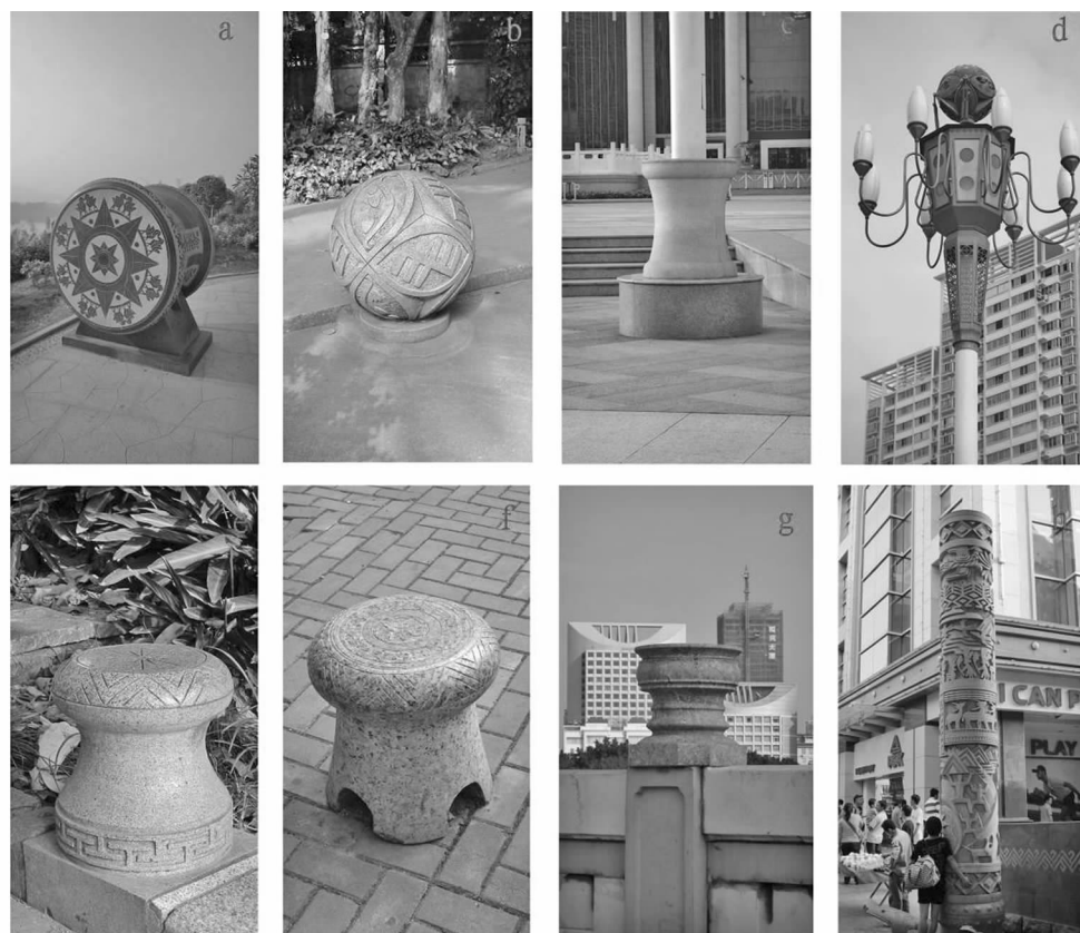
图 3 铜鼓、绣球和图腾柱等景观小品

还有很多具有壮族文化特色的景观小品存在于南宁市的各个角落,如民族广场照明灯柱的底座是一个可爱的铜鼓造型,灯的顶端则是一个美丽的绣球(见图 3c、d)。公园内有各种造型可爱的铜鼓小石凳(见图 3e、f)。在南湖大桥栏杆上有一个个铜鼓小品(见图 3g),民生步行街入口有一根高大的壮族图腾柱(见图 3h),壮族文化早已与人们的生活融为一体。