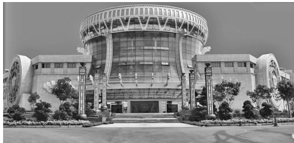
图 6 广西民族博物馆

自然条件、历史文化遗产、审美观念、性格爱好的差异,使得不同地域的建筑显现出了风格迥异的表达形式。在广西首府南宁,壮族文化元素被广泛应用于城市建筑设计和装饰中,许多重要建筑都以壮锦图案为标识性装饰。而广西民族博物馆,作为民族文化专题博物馆,其设计也极具民族特色,主体建筑外形取材于富有广西地域特色和民族特色的铜鼓,整个建筑如一只展翅的鲲鹏,遨游于青山绿水之间(见图 6)。其内部的大厅墙面设计也充分融入了壮族文化元素,将壮族传统的羽人纹、划船纹、翔鹭纹、鱼纹和钱纹等纹饰进行组合,以强烈的视觉冲击力,让人感受到扑面而来的壮族文化气息(见图 7)。