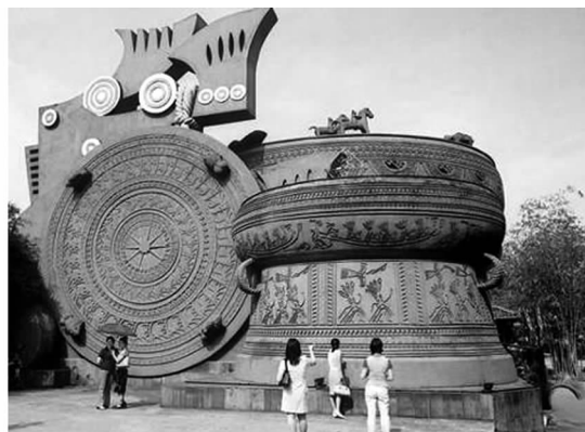
图 10 广西民族文物苑内的铜鼓巨雕 Fig. 10 Bronze drum in Guangxi Relics Park of Nationalities

植物不同于其它造景元素最大的特点在于,它的生命性和不可完全模仿与复制性。植物是园