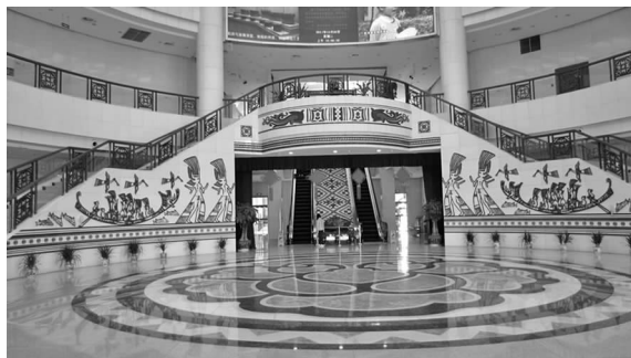
图 7 广西民族博物馆大厅墙面