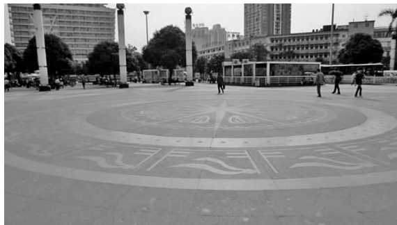
图 8 南宁市火车站站前广场的地面铺装

园林空间中道路和广场等各种硬质铺装是园林的骨架和网络,铺装本身的线性、质感、色彩、图案在不同环境中的变化,能使人在园林空间中获得行为与心理方面的综合感受 [6] 。壮族文化元素也常常融入到广场的铺装设计中,体现地域特色。运用较多的是铜鼓的鼓面纹饰,如南宁市火车站站前广场和五象广场的铜鼓鼓面装饰图案,丰富了广场的民族文化内涵(见图 8、图 9)。