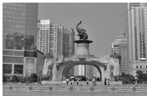
图1 南宁市五象广场

城市雕塑作为一个城市的地标建筑,往往具有地域色彩和民族文化标志性,它的存在,体现了这个城市的精神面貌与城市的文化建设。它将民族过去的文化与历史作为一种形象延续着,更是在唤起壮乡儿女对传统文化的记忆和普遍认同感。如图1为南宁市五象广场的五象雕塑,其主象脚下便踩着一只巨大的铜鼓。图2为南宁市青秀山风景区的壮锦广场,整体设计采用壮族风格,舞台背景是一个巨大的铜鼓雕塑群,该广场是目前全国最大的铜鼓歌台 [4] 。