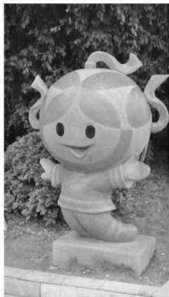
图 5 吉祥物“桂娃”

的简称,该吉祥物是以壮族绣球为原型创作的拟人卡通形象。她身穿壮族传统服饰,颜色以红色为主调,凸显壮族文化特色的同时也烘托出 50 周年大庆的喜悦气氛(见图 5)。